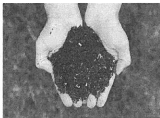
Compost obtenu après la transformation de matières organiques

De plus, c'est un engrais 100 % naturel !